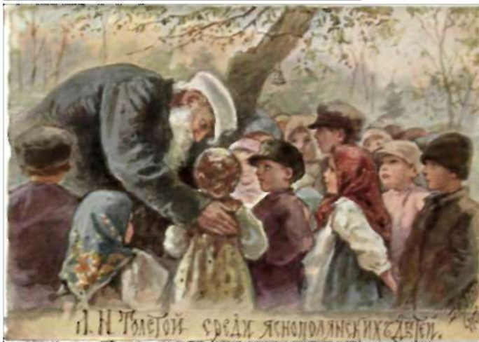
Л. Н. Толстой среди яснополянских детей.

Нет такого человека, который бы не читал художественных произведений Льва Николаевича Толстого. Школьник заканчивает изучение букваря чтением коротеньких рассказов Льва Николаевича и далее не расстается с великим знатоком человеческой души и непревзойденным мастером слова в течение всех школьных лет. Не все, однако, знают, что Лев Николаевич Толстой является также замечательным учителем и воспитателем детей, великим педагогом.